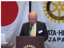
●野崎 裕 幹事 ・理事会報告 ・ロータリーレート 116円 3/1